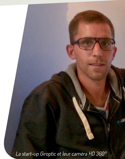
La start-up Giroptic et leur caméra HD 360°

Une métropole incitante et innovante, inspirante et encourageante, une métropole qui soit elle-même entreprenante et ouverte ! »