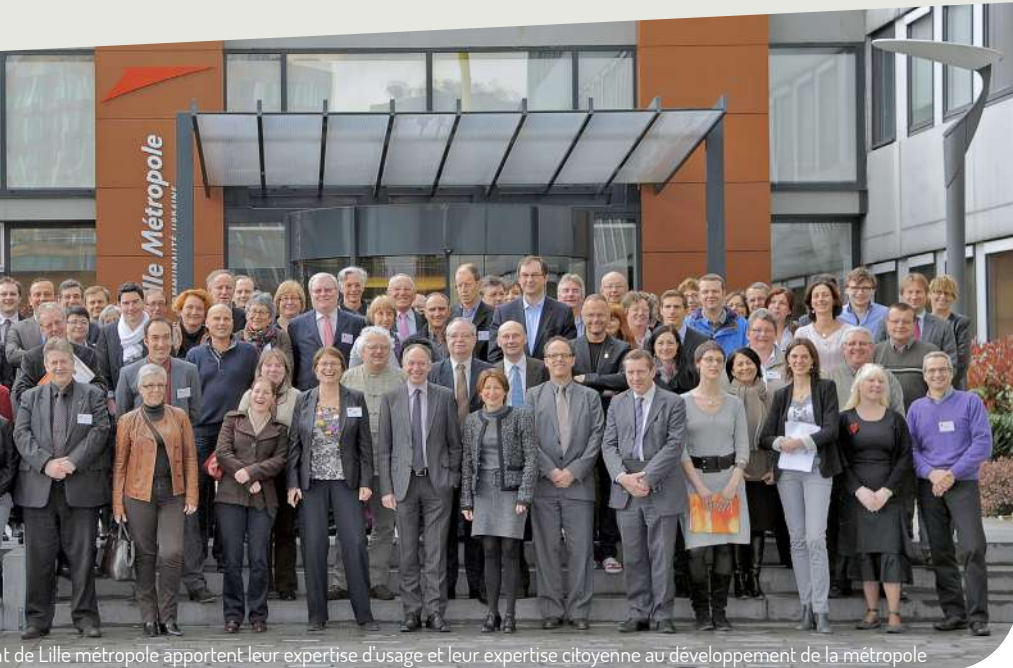
Les membres du Conseil de développement de Lille métropole apportent leur expertise d'usage et leur expertise citoyenne au développement de la métropole