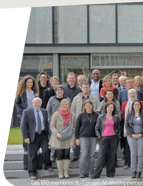
Les 180 membres du Conseil de développement

« La Métropole n'a rien à envier à d'autres en termes d'infrastructures et de grands équipements. Notre impact sur le monde environnant est désormais intégré et nous portons plus d'intérêt à nos déplacements, nos déchets, notre santé et notre alimentation. Les technologies se sont affranchies du temps et de la distance. Elles apportent instantanéité, confort, information mais nous déconnectent de la réalité. Tout va très vite, nous n'avons plus le temps de nous adapter. La confiance ne règne pas toujours. L'individualisme en profite pour s'installer aux premières loges. Impliquer le citoyen n'est pas chose facile. Il devient difficile de résoudre cette équation paradoxale de l'équilibre entre individualisme et lien social. »