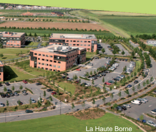
La Haute Borne