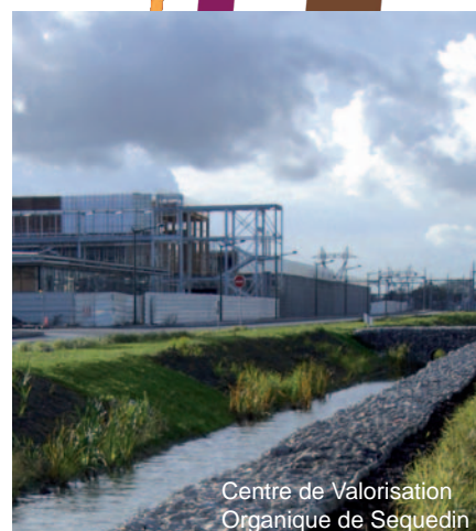
Centre de Valorisation Organique de Sequedin