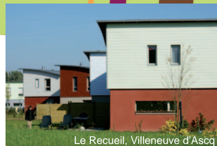
Le Recueil, Villeneuve d'Ascq

Le SCOT fixe le cadre de toutes les politiques publiques (habitat, développement économique, déplacements,...) qui doivent être compatibles avec ce « supra » document d'urbanisme.